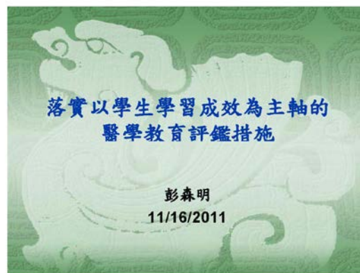
照片 4 說明：演講投影片