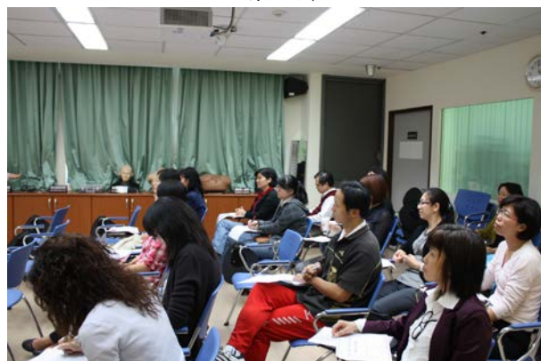
照片 2 說明：與會人員