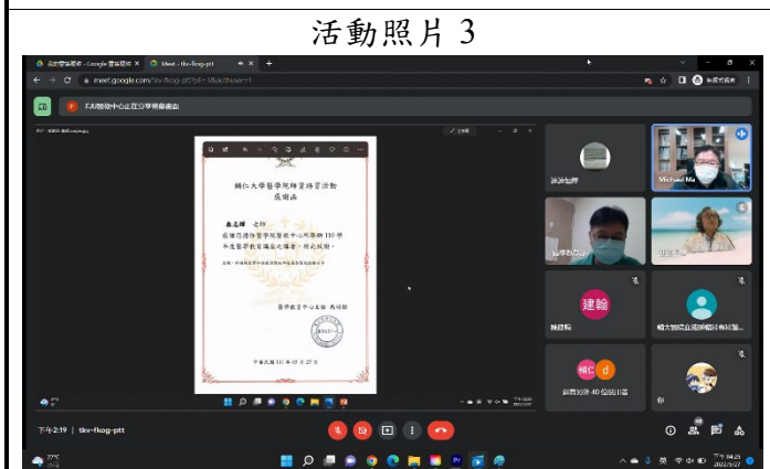
照片 3 說明：馬明傑主任頒與秦志輝醫師感謝狀。