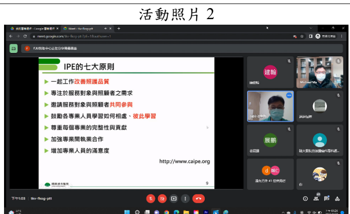
照片 2 說明：秦志輝醫師講課中。