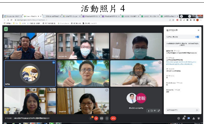
照片 4 說明：全員大合照。