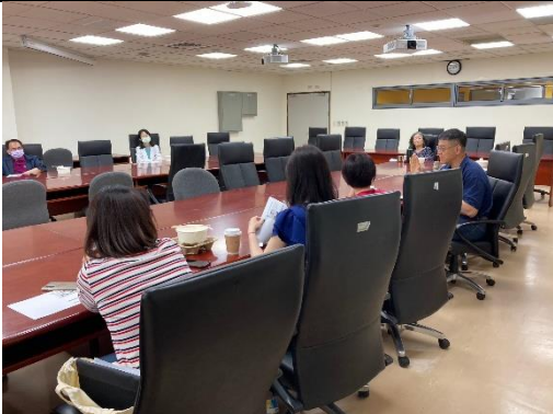
照片 3 說明： 參與教師回應問題。