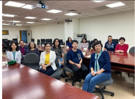
照片 4 說明： 全員大合照。