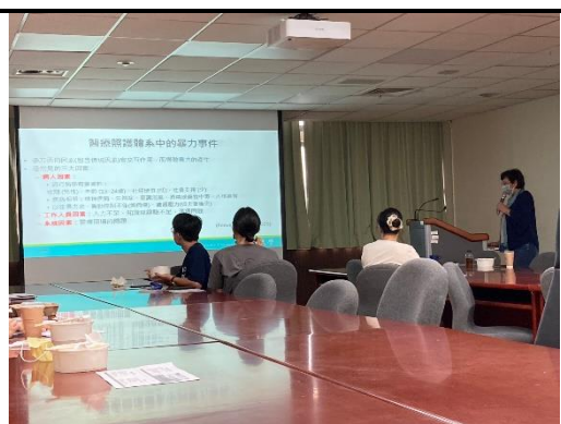
照片 2 說明： 講者分享相關經驗。