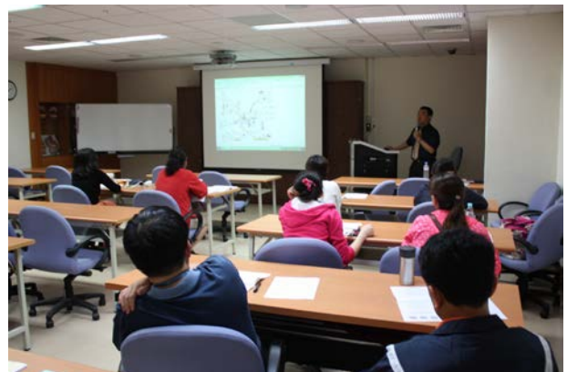
照 2 說明：學員聽講情形