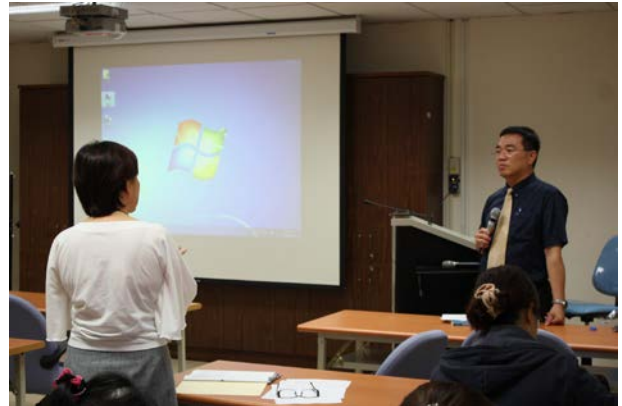
照片 4 說明：Q&A 時間