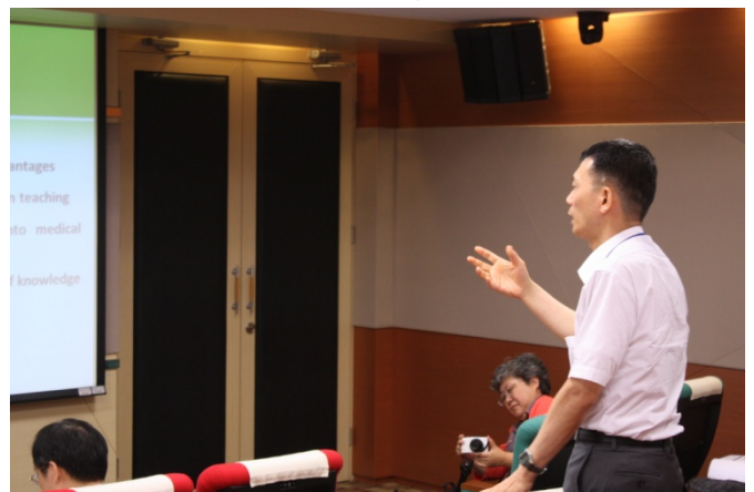
照片 4 說明：Q&A